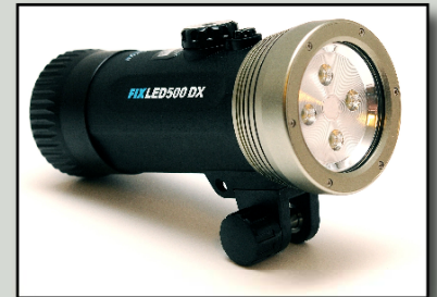
Mer info på www.fisheye-co.jp

FIX LED500DX - 3 895 SEK FIX LED1000DX - 6 950 SEK