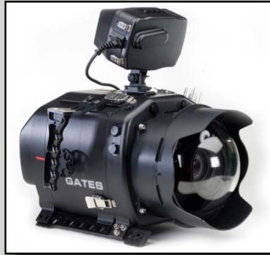
Gates nya UV-hus för RED www.gateshousings.com

Den sk "You tube" filmaren gör oftast sina alster en kompakt kamera med videofunktion.