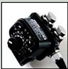
SEA&SEA fantastiska TTL-konverter

Fördelen med TTL är att den hjälper fotografen att få rätt mängd blyxtljus utan några besvärliga inställningar och vid rörliga motiv är det en enorm fördel.