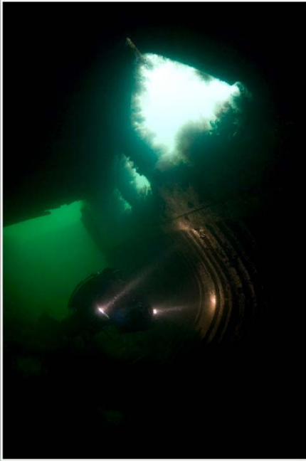
Videofilmande dykare i vraket i Limhamn!