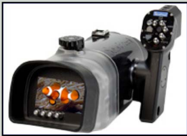
Seatool housings www.fisheye-co.jp

Videomarknaden börjar röra sig igen och vi ser två olika användare. Dels den kräsne, kvalitetstörstande entusiasten som vill ha det bäst som finns på marknaden och då svarar vi oftast Gates och Seatool. Ikelite har ett komplett sortiment för de flesta videokameror och är ett mer prisvärt alternativ.