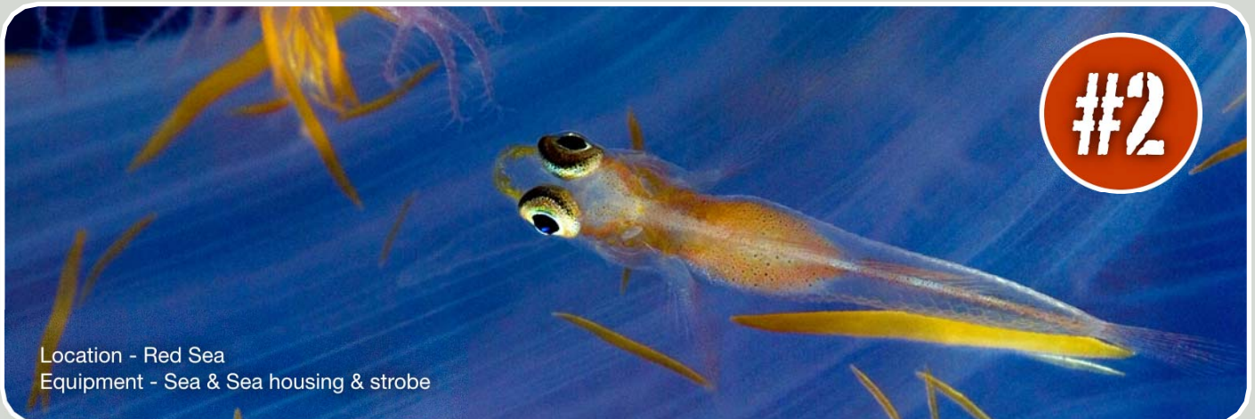
Location - Red Sea Equipment - Sea & Sea housing & strobe