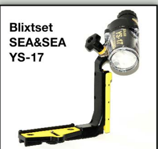
Blyxtset SEA&SEA YS-17

Den interna blyxten på kompaktkameror är svag och sitter dåligt placerad för UV-fotografering. Det som krävs för att få tryck i